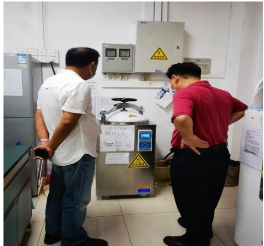
学 导现场检查 压灭 备