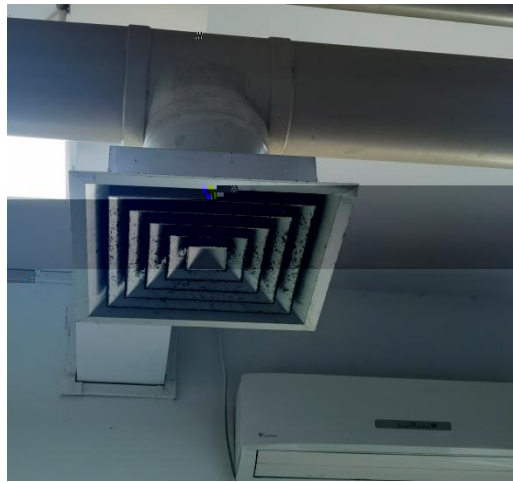
C425 C429 C430