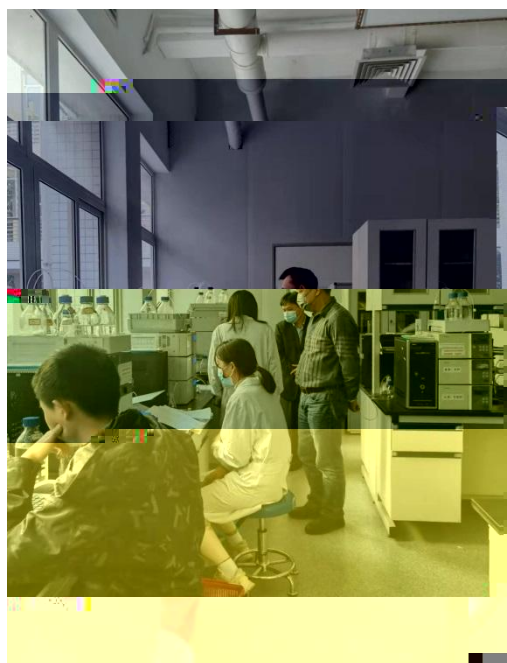
场 一 和 分 学 实 室