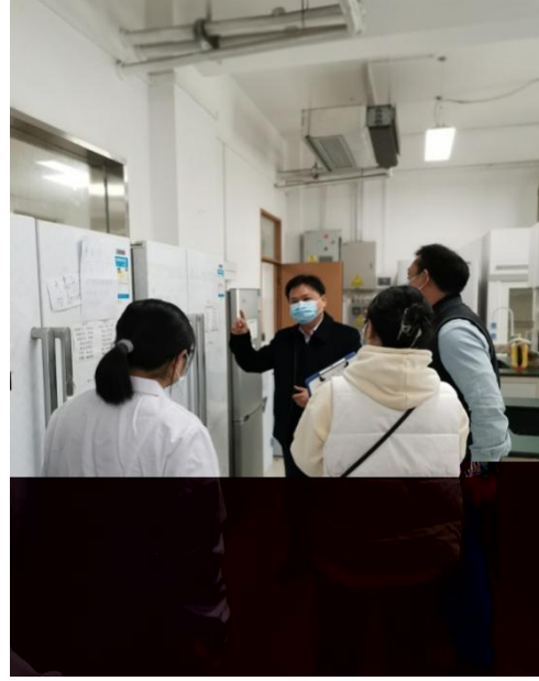
学院领导检查药物化学学部科研实验室