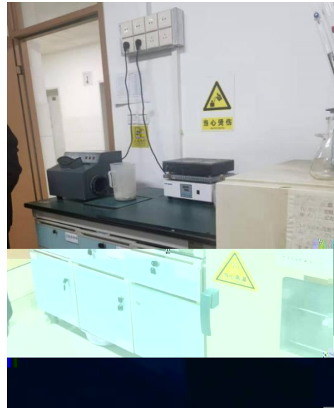
C426 实验室仪器设备标识清楚